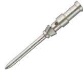
Einzelkontakt (Stift), VPE 50 Stück Single contact (Male), PU 50 pieces