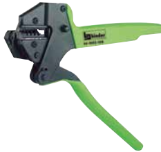
Crimpzange für gedrehte Crimpkontakte Crimping tool for turned crimp contacts