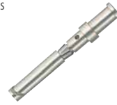
Einzelkontakt (Buchse), VPE 50 Stück Single contact (Female), PU 50 pieces