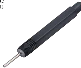
Lösewerkzeug für Kontakte Extraction tool for contacts